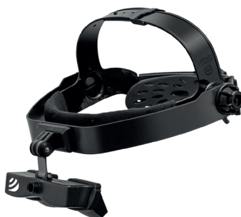
Mayor comodidad al trabajar con gafas OLED