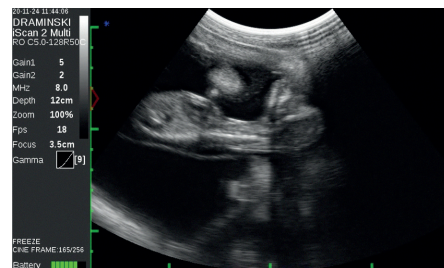
Excelente calidad de imagen