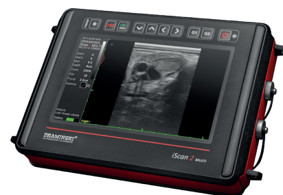
Durable, ligero, cómodo