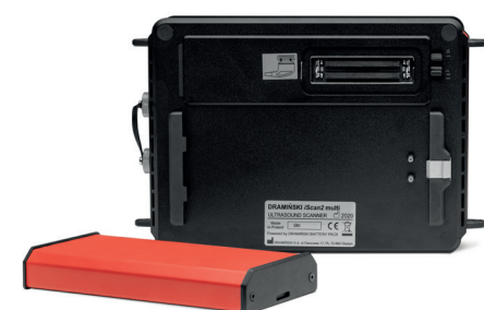
Sondas y batería desmontables